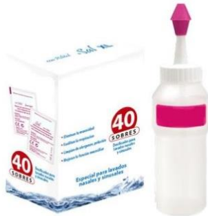
Kit para lavados nasales con botella de al menos 250 ml. y sobres de sal.