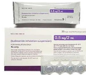
Ampollas de medicación, siguiendo la prescripción médica